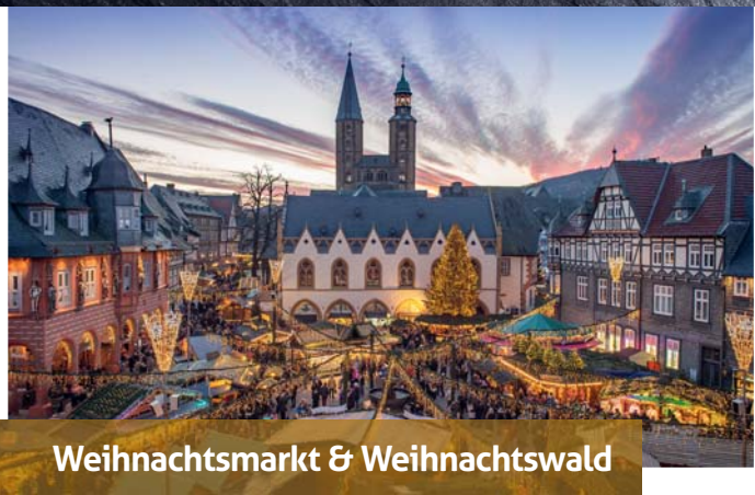
Weihnachtsmarkt & Weihnachtswald

Alle Jahre wieder erstrahlt Goslar in der Weihnachtszeit im festlichen Glanz. Von der Kulisse des Marktplatzes romantisch eingerahmt laden 80 urige, liebevoll dekorierte Holzhütten zum Bummeln und Schlemmen ein. Im märchenhaften Weihnachtswald auf dem Schuhhof inmitten der historischen Altstadt lässt es sich vor mittelalterlicher Fachwerkkulisse gemütlich Punsch trinken, mit Freunden treffen, entspannt plaudern und die Adventszeit genießen.