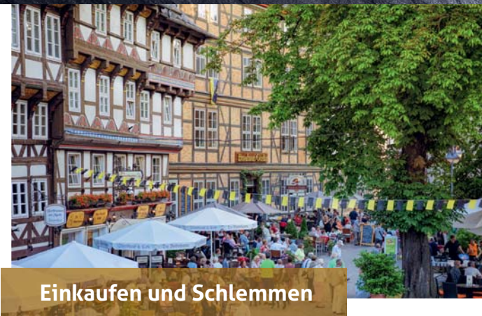
Einkaufen und Schlemmen

Profis: Harzer Hexen Stieg - ein etwa 100 km langer Wanderweg, der durch Deutschlands nördlichstes Mittelgebirge und auch entlang des Brockens führt.