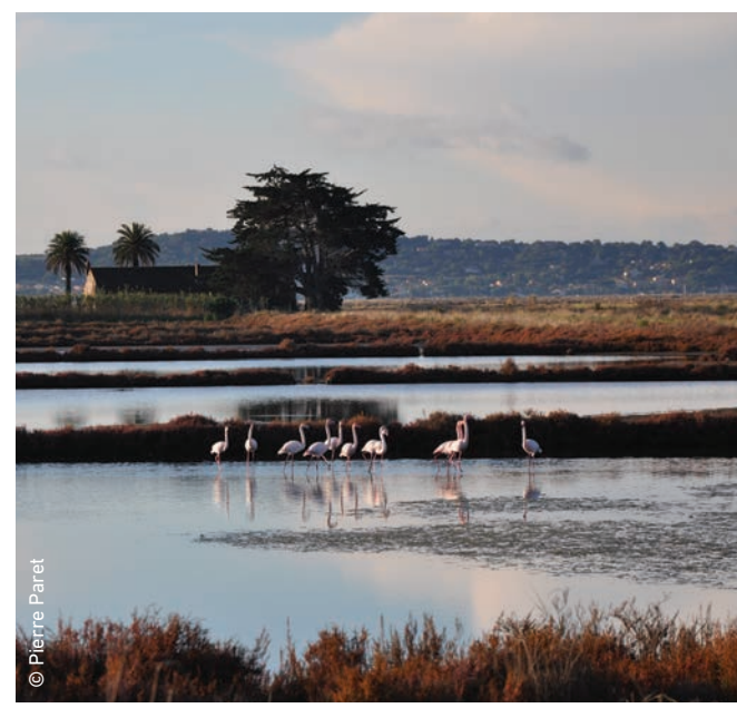
● Visitez les salins