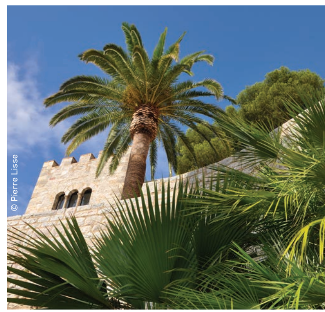
● Visitez les jardins