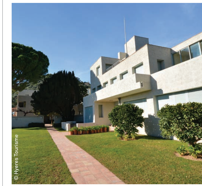
● Découvrez la Villa Noailles