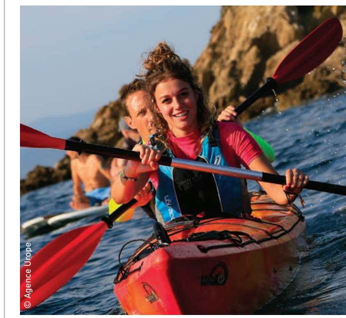
● Loisirs, activités, billetterie