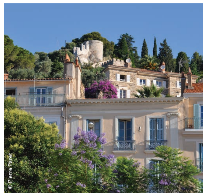
● Visites guidées, balades, découvertes