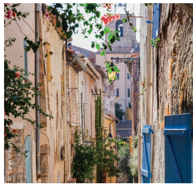
● Visitez la vieille ville