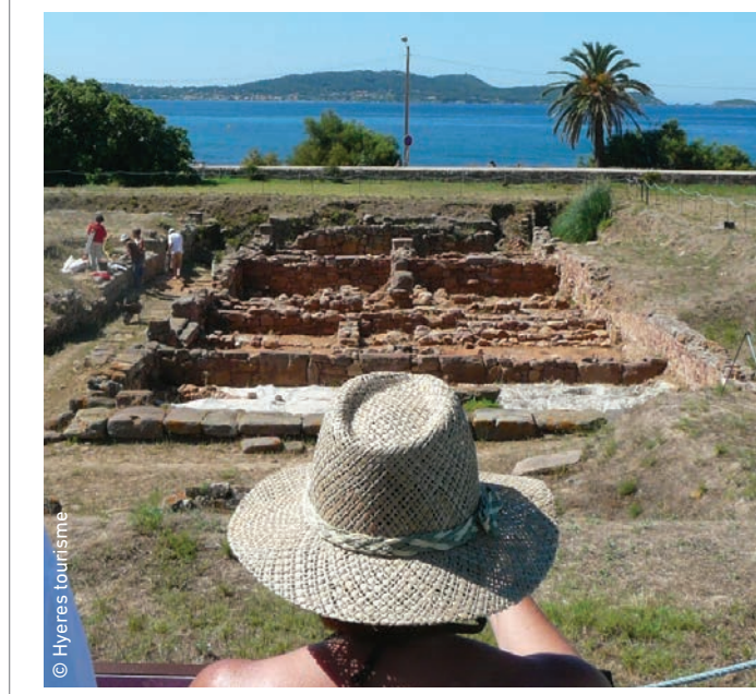
● Découvrez le site archéologique d'Olbia