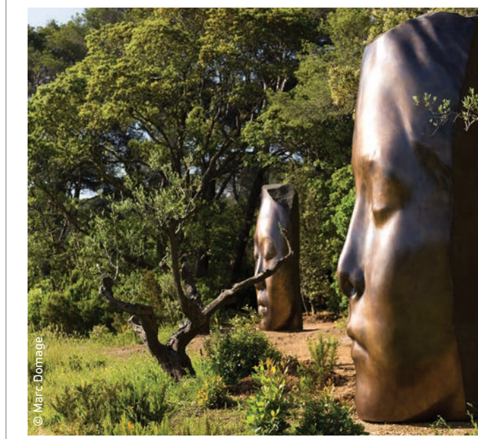
● Découvrez la Villa Carmignac