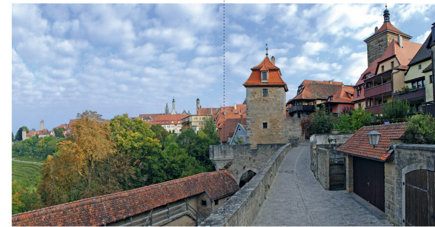
Stadtmauer am Kobolzer Tor (X)