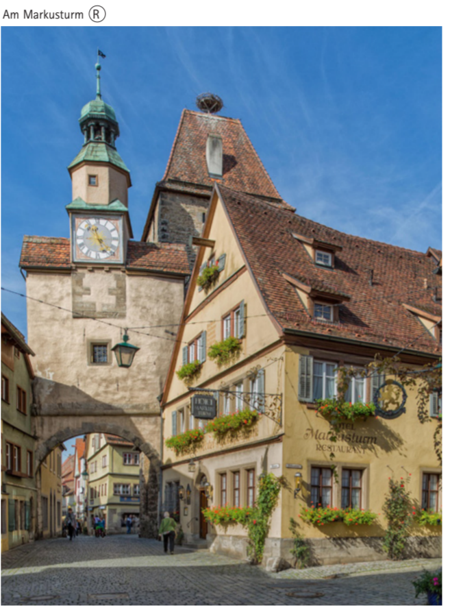
Am Marksturm (A)

Das mittelalterliche Flair ist maßgeblich geprägt durch das Kopfsteinpflaster, das zu Rothenburg gehört wie die umgebende Stadtmauer. Die zum Teil beträchtlichen Höhenunterschiede in der malerischen Stadtkulisse oberhalb der Tauber sind Reiz und Last zugleich. Die wundervoll verwinkelte Architektur birgt Schönheit, aber auch Herausforderungen für Bewohner wie Besucher. Und wie es sich mit ehrwürdigen Gemäuern aus vergangenen Jahrhunderten verhält: Alle Sperrigkeit lässt sich nicht auflösen, soll das mittelalterliche Kleinod seinen einmaligen Charakter bewahren. Mit beständigen Schritten spürbare Verbesserungen zu erreichen und Barrieren zu minimieren ist Ziel unserer Stadt.