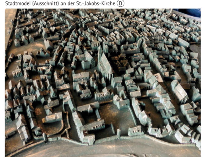
Stadtmodell (Ausschnitt) an der St.-Jakobs-Kirche (D)