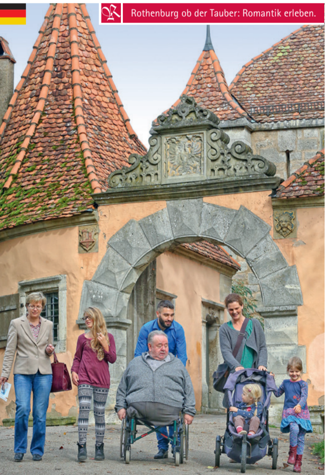
Rothenburg ob der Tauber: Romantik erleben.